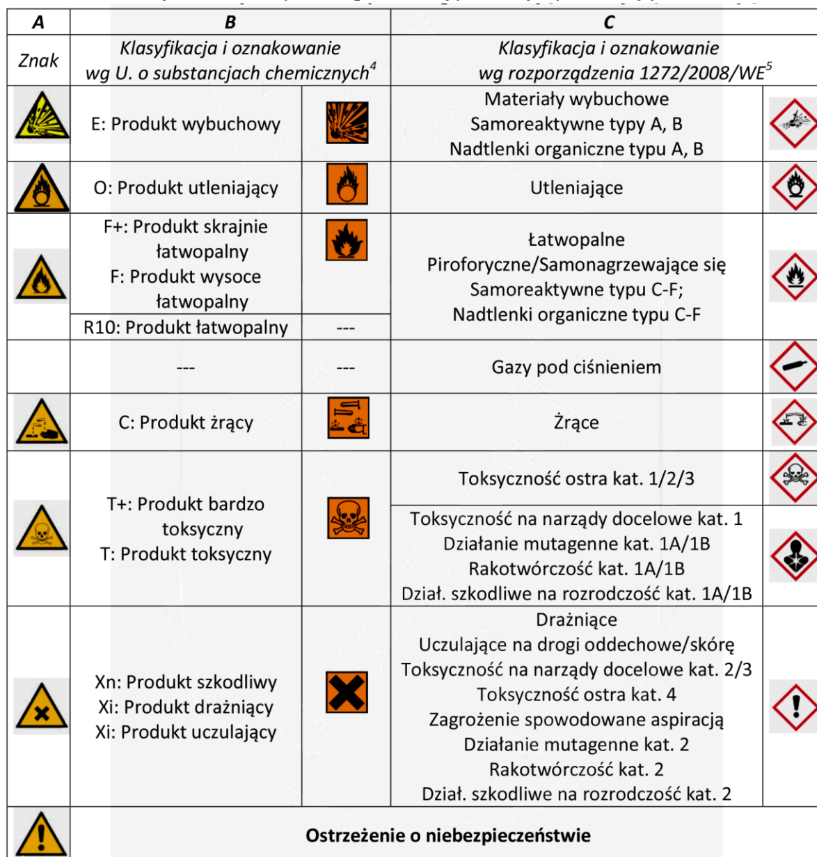
Tabela 1. Substancje i mieszaniny niebezpieczne objęte niniejszą instrukcją: